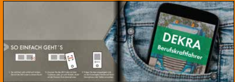
Abrufen von aktuellen digitalen Medien dank integrierter Codes