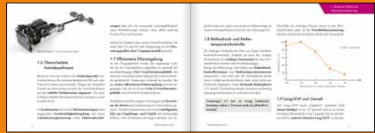
Aktuelle Infos kompakt, 64 praxistaugliche Seiten pro Modul

Offene Seminare können Sie auch direkt online buchen: www.dekra-akademie.de